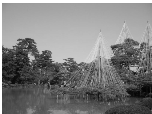
図 4: 兼六園公園

金沢市は日本海沿岸にある石川県の県庁所在地だ。人口は 42 万人で日本では平均的な大きさの町だ。位置は海と山の間で、自然が美しい所だ。昔の城下町だが、現在は城はなく、その庭だった有名な兼六園公園が残っている。古い寺や家もまだあちこちにあり、九谷焼や加賀友禅等伝統的な産業が盛んだ。魚や他の料理もとても美味しい。